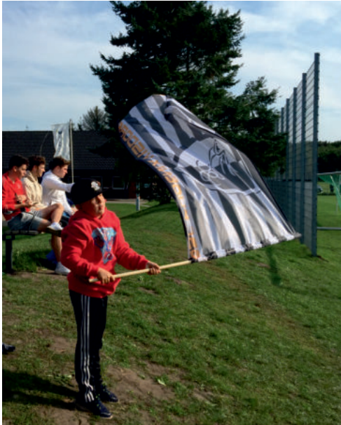
Der kleine Fahnenschwenker am Spielfeldrand