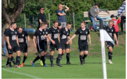
Kollektiver Jubel an der Eckfahne nach dem 4:3